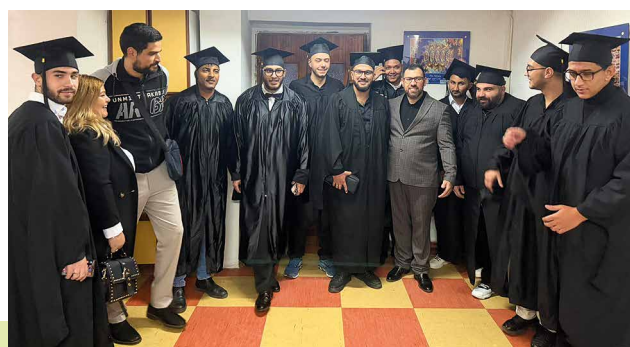
Ein Teil der 65 Studenten bei der Bibelschulabschlussfeier mit Diplomübergabe